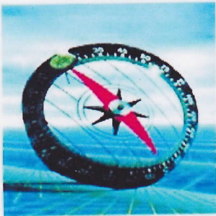
コンパスコントローラー

常時エンジンとコンプレッサーの状態をモニターし最適の状態にするシステムの頭脳です