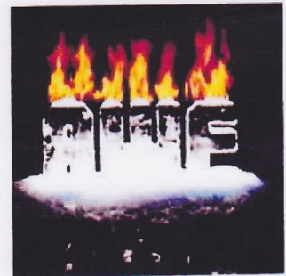
サルエア純正オイル