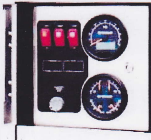
制御用表示パネル

常時エンジンとコンプレッサーの状態をモニターし最適の状態にするシステムの頭脳です